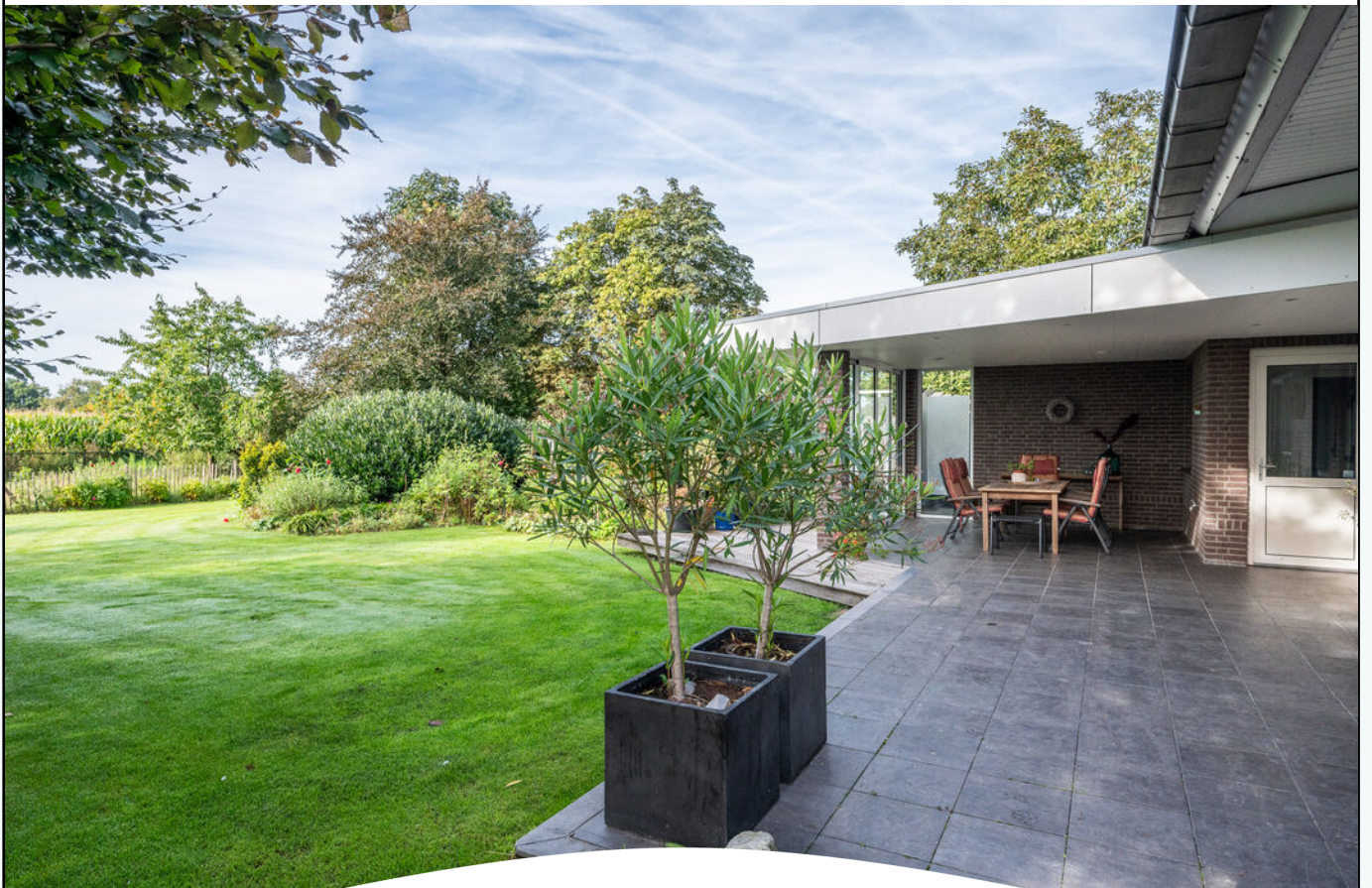
SMULDERSLAAN 51 SOMEREN