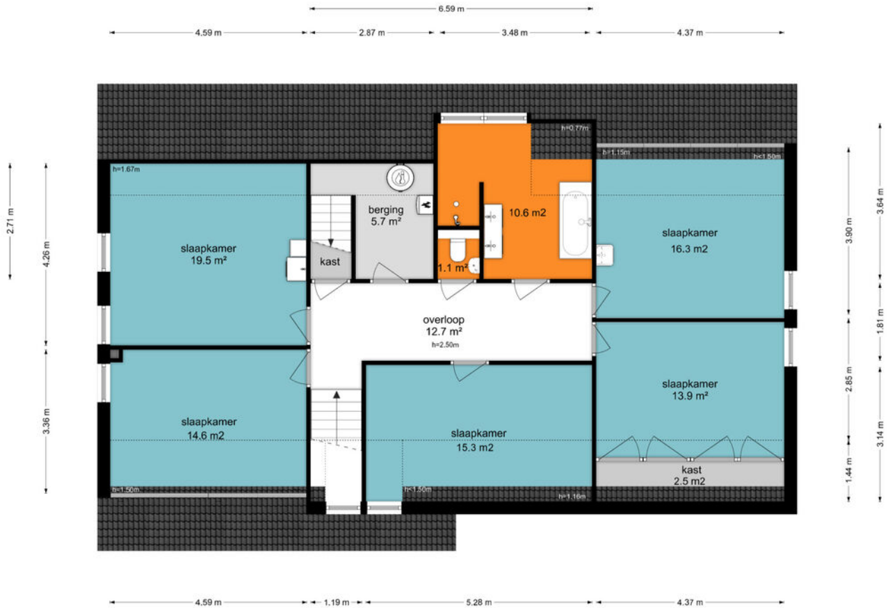
Smulderslaan 51 - Someren Eerste Verdieping

De plattegronden zijn geproduceerd voor promotionele doeleinden en ter indicatie. Aan de plattegronden kunnen geen rechten worden ontleend. © www.objectenoo.nl