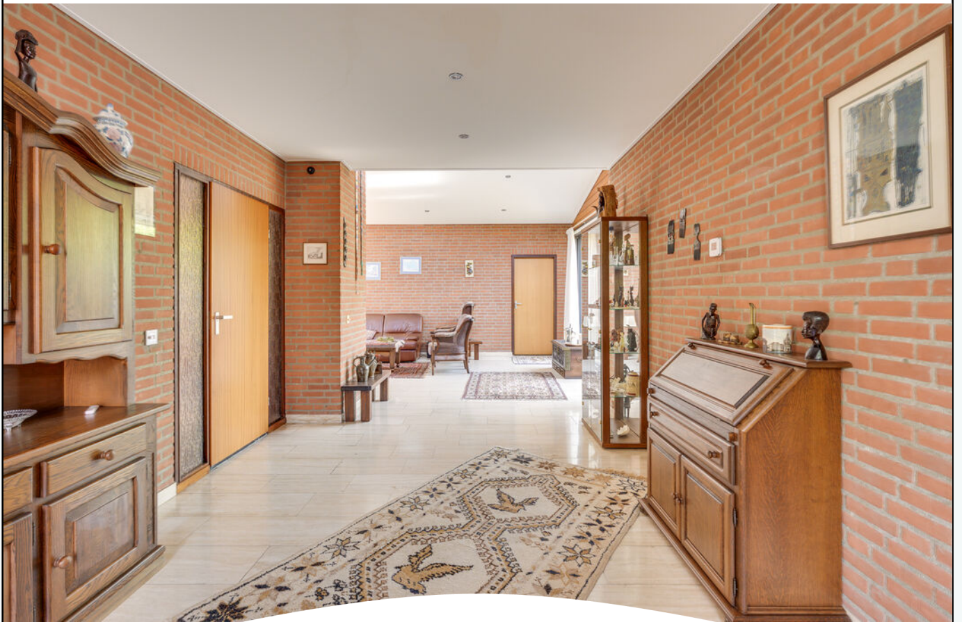
WARMELO 25 EINDHOVEN